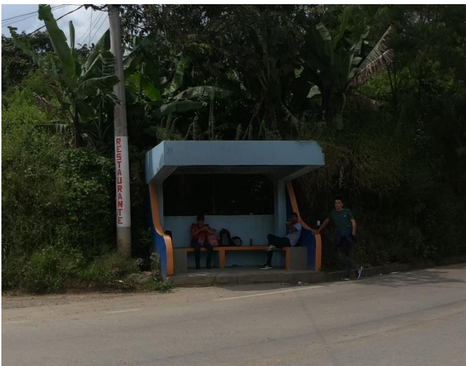
1°27'4" N – 77°06'27" O – Paradero Rosa Florida – 1.680 m.s.n.m.

Así fue y en el recinto de las busetas nos informaron que no había ningún transporte hasta el pueblo de Arboleda-Berruecos por el mal estado de la vía. Sin embargo, un conductor estaba dispuesto a llevarnos hasta el cruce de Rosa Florida dónde sale la pista a Berruecos.