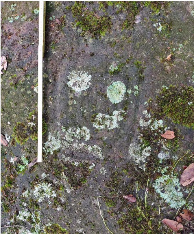
Petroglifo observado en el monolito #2 conjunto "Piedra Grande".

Aprovechamos la frescura relativa del bosque para charlar un rato antes de volver a subir el pastizal empinado hasta la finca de Don Erazo y la carretera.