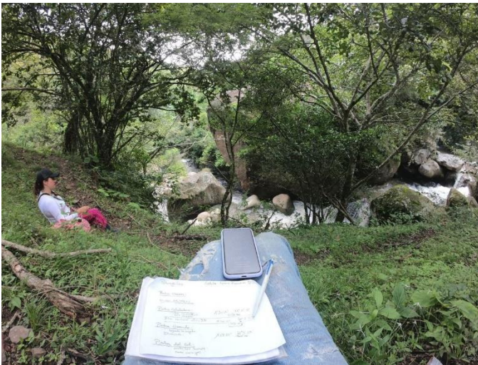
1°29'18" N – 77°09'25" O - a 1'600 m.s.n.m. pausa frente a la roca.

Siguiendo la vía y bajando, en una curva dónde se ubica la finca de Don Erazo, arranca la trocha que lleva a los caminantes a la "Piedra Grande". El Señor nos regala una rica y jugosa naranja la cual nos cae bien con el calor que hace. Estamos cerca de 1.700 metros s.n.m. Llegamos a un portón de madera dónde hay que entrar a un pastizal con fuerte pendiente. Desde este punto ya se puede observar "Piedra Grande" en el fondo del cañon del río Masamorra.