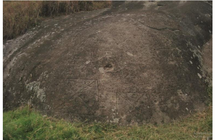
1°27'41" N – 77°08'09" O – Piedra de Lourdes – 2.150 m.s.n.m.

Son alrededor de las 4:00 pm y el clima está nublado, pero caminamos hasta la impresionante "Piedra de Lourdes" ubicada a la entrada de la aglomeración. Tiene una serie de petroglifos encima y una cerca de un vecino indelicado que no valora el monumento.