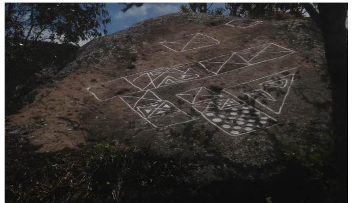
Petroglifos de la "Piedra del Mapa" – registro agosto 2013

La neblina está desvaneciendo lentamente y ofrece un hermoso espectáculo. Por haber estado antes en junio del 2012 y en agosto del 2013, la encuentro fácilmente y observo que los árboles a su alrededor han crecido, incluso, uno ha caído sobre el monolito.