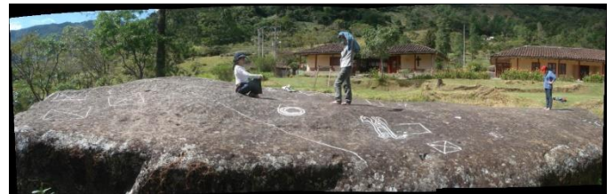
Registro de los petroglifos en la "Piedra del Sol" – junio 2012.