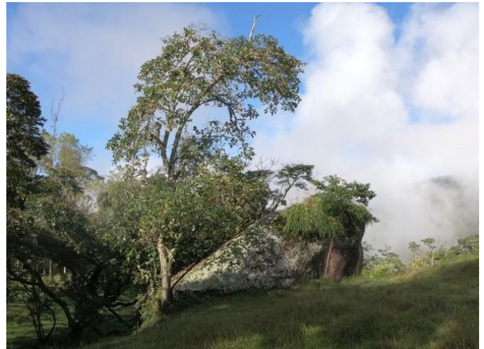
1°30'15" N – 77°08'19" O – Piedra del Mapa – 2.130 m.s.n.m.

El sábado, 5 de febrero de 2022, aprovechando el tiempo, me voy en búsqueda de la "Piedra del Mapa" también conocida "Piedra del Cementerio" ubicada cerca del pueblo, precisamente al lado del cementerio.