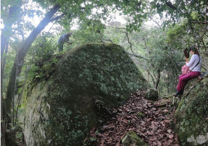
1°24'01" N – 77°09'25" O – a 1.590 m.s.n.m.

otro, Felipe logra subir y limpiar una parte para descubrir un petroglifo inédito.