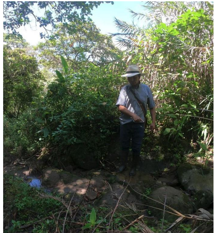
Camino de herradura o “Camino Real” en la Vereda La Oloya.

Descubrimos el camino de herradura el cual fue usado hasta finales del siglo XIX. Este mismo nos lleva hacia la actual vía destapada que conduce a La Cañada, a la orilla del río Juanambú.