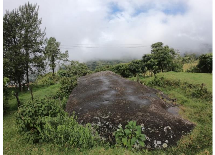
1°30'10" N – 77°07'56" O a 2.250 m.s.n.m.

El día domingo, 6 de febrero amanece muy nublado y húmedo. Mientras que Jacky busca un lugar dónde desayunar, aprovecho el tiempo para subir a la "Piedra del Sol" o "Rumi Cusiyo" – piedra de los monos en quechua.