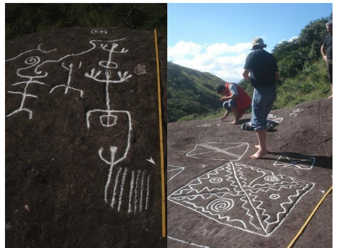
Petroglifos de "Piedra Grande" – registro agosto 2013

En el siguiente enlace, se puede admirar mejor el lugar: https://youtu.be/bxEvSVXLGDU Patrimonio Arqueológico de Berruecos - Piedra Grande – 1'48"